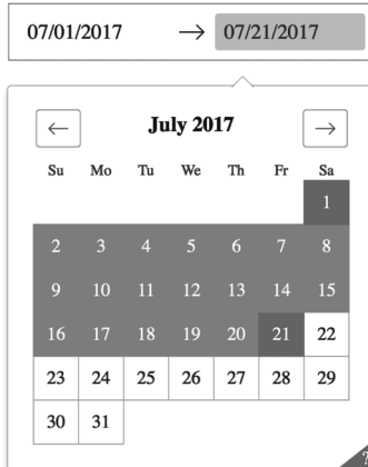
図 1 Dash で作成したスケジュール期間選択のレイアウト

Javascript などに精通していなくても、高度な機能をもつ UI コンポーネントを Web アプリケーション内で利用することができる。下に、スケジュール期間を選択できる Web アプリケーションの例を示す。(Dash に関する詳しい説明は Dash のホームページを参照されたい 5 。)